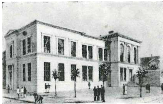
Ehemaliges Gymnasium Predigerstraße — Museum in der Zeit von 1892 -1906

Im „Ethnographischen“ Zimmer zeigte man Erzeugnisse und Erinnerungen, die dem Museum von Nordhäuser Söhnen nach ihrer „stolzen