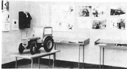
Ausstellungs- raum 1949 -

Besonders am Herzen liegt uns die Zusammenarbeit mit der Arbeiterklasse, vor allem mit unseren drei Patenbrigaden aus dem VEB NOBAS- Schwermaschinenbau und dem VEB Fernmeldewerk.