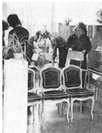
Der Jugendklub bei der Vorbereitung eines Museumskonzertes