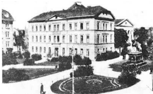
Schule am ehemaligen Friedrich- Wilhelm- Platz — Museum in der Zeit von 1907 - 1934